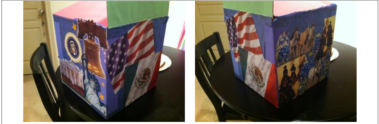
IMAGEN DE LA CAJA DE ESTUDIOS SOCIALES